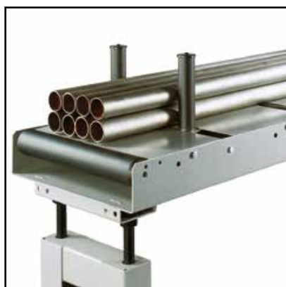
Coppia di rulli verticali (Optional)

Piano a rulli di scarico con asta millimetrata e riscontro di misura. 1° elemento, lunghezza 2m con portata max 700kg