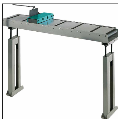
Piano a rulli di scarico con asta millimetrata (Optional)

Piano a rulli di scarico con asta millimetrata e riscontro di misura. 1° elemento, lunghezza 2m con portata max 700kg